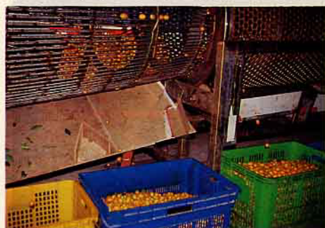
利用選果機自動分級

保障，不僅看天、還要看人吃飯的前塵往事，仍略顯激動。在一一詢問村民的意願後，短短數日即集資1千9百餘萬。這股為反抗長期不合理剝削而匯集的向心力與團隊精神，讓藍書記深受感動：「一股5萬耶，大家卻眉都不皺地踴躍認股，真是作夢也想不到！」加上政府之補助及農業低利貸款後，一座現代化的加工廠即在83年11月10日興建完成，展開產、製、貯、銷一元化作業。在努力研發新產品目標下，目前產品已多達十幾項，包括金棗酥、金棗香檳、金棗果醬、金棗果汁……等等，其中金棗酥更連續三