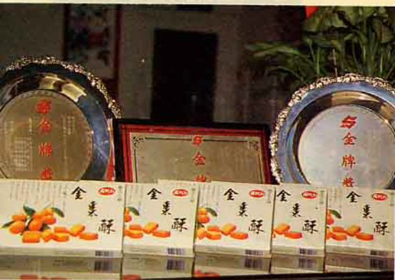
金棗酥獲獎連連，品質保證