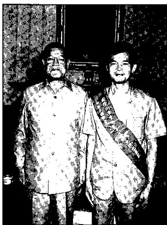
當選全國十大傑出農家接受李總統嘉勉