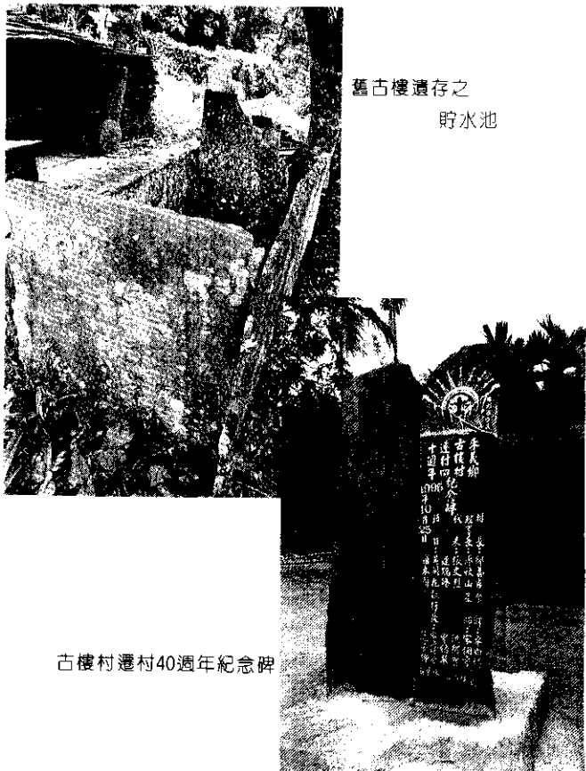
舊古樓遺存之 貯水池

舊古樓部落的起源，據說是由社內兩系頭目，自大武山遷來，世代相傳沿襲到現在，已經有300多年歷史，是非常具有歷史價值的廢墟。舊古樓兩系頭目宗族的族人，世代衍生傳至日據時代，是最鼎盛