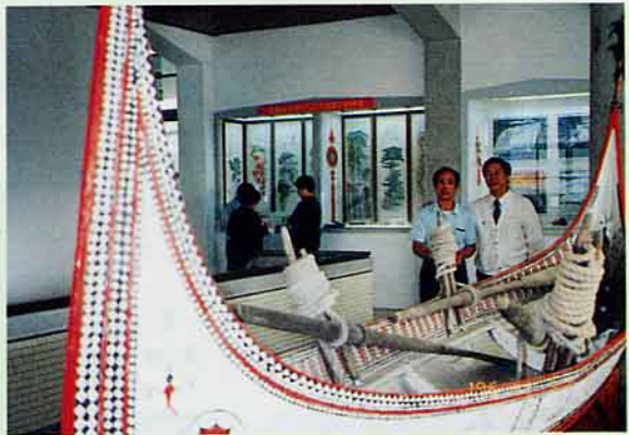
童玩櫥窗一景（展示的內容包括蘭嶼獨木舟、童玩、油畫、中國節）