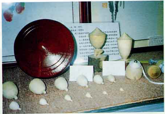
「陀螺」系列，計有18顆，是展示作品中的最大族群