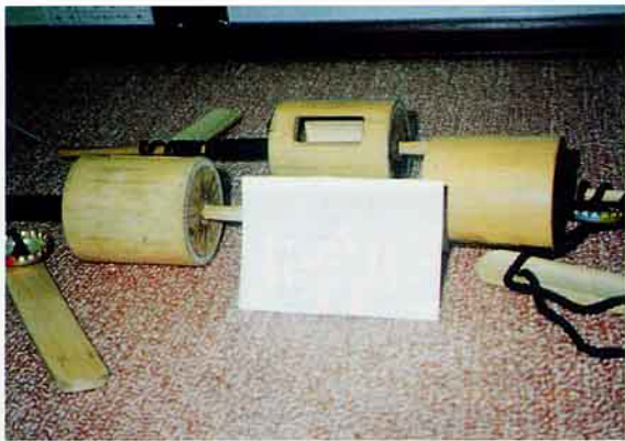
「地鈴」如果會玩的話，可以旋轉發出很大的響聲