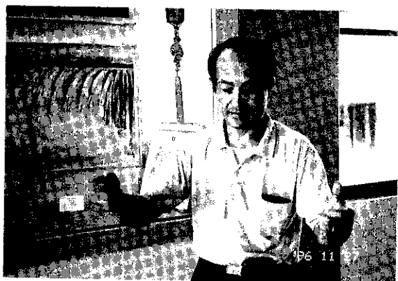
「蟬兒吱吱響」的製作材料為一條繩子，穿過一個被壓平的酒瓶蓋所組成