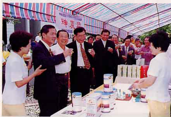
長官來賓品嚐有機產品