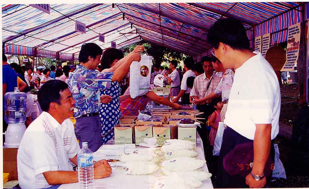
有機產品展售區一角