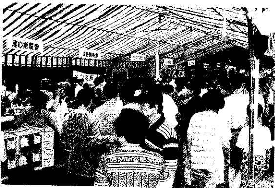
鄉鎮農特產展售區