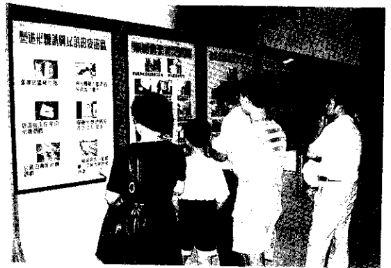
海報及資材展示區