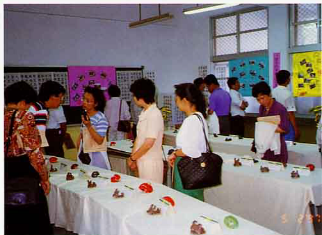
四健會員的手工藝品展示

參加體驗營的學員約有120幾名，全體學員在大林鎮農會推廣股集合，出發至大林鎮參觀蕃石榴栽培管理介紹，之後又觀賞了花卉栽培——蘭花。而後就直達——梅山鄉太平村的三元宮，它離我們平地的海拔高度約有1千公尺之高，一路上我們觀賞著車外的風景，一面唱著歌，不知什麼時候已到達三元宮！此時已是12：00多了，每個人飢腸轆轆，肚子咕嚕的叫，用畢中餐，約13：30，開始舉行開幕典禮的儀式，由周祕書主持。