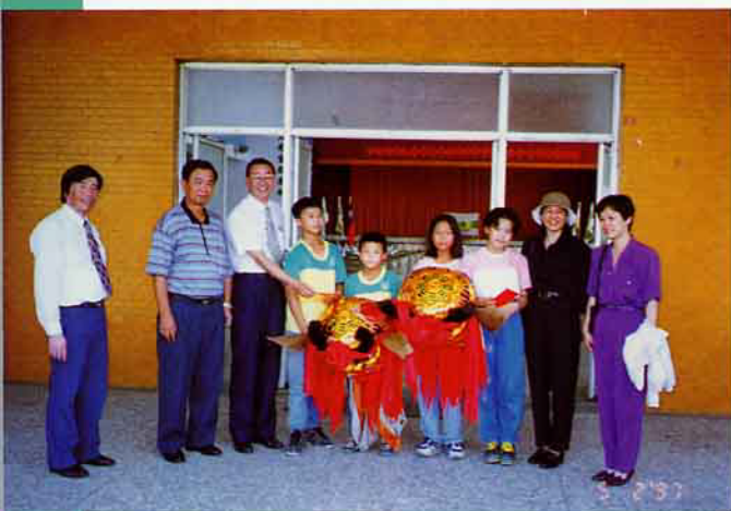
水上鄉農會林總幹事到場鼓勵