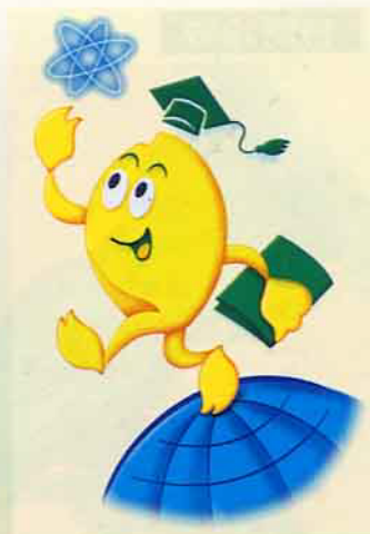
米博士是大甲鎮農會的吉祥物

角色，它普遍深入農村，保障農民權益、提高農民知識技能、促進農業現代化、增進農民收益等等，但是由於農業面臨經濟和貿易自由化的衝擊，以及產銷結構僵化的影響，都使農會走到該轉型的時點了。