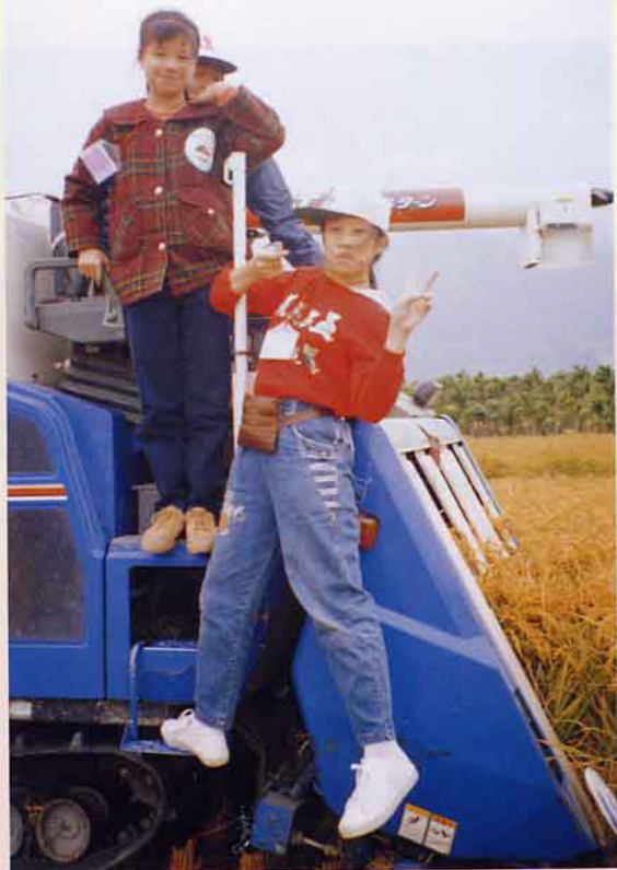
看看我的雄姿，還可以吧

→ 四、由於重視環保風氣使然，且轄內近期中將陸續闢建完成，是全台面積最大的，也是首創的一座環保親水公園，計有32公頃，還有第一座親水腳踏車休閒車道，因此將進而帶動關山鎮走向前衛，卻又不失純樸。