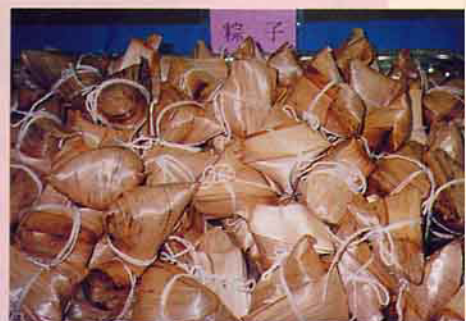
關山米食鄉點—粽子