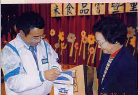
東門國小金校長(右)致贈紀念品(錦旗)給關山鎮農會，由黃理事長(左)代表接受

爲什麼要造訪台東縣的關山鎮？這除了是台灣省政府農林廳、台東縣政府、台東區農業改良場、關山鎮農會、及關山鎮