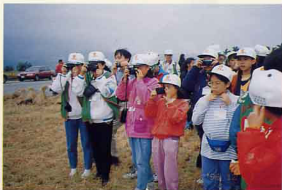
搶鏡頭，紛紛拍下美好的一刻

一、關山鎮是全台地區，計60個相同稱為「鎮」級的地方中，最小的鎮。全鎮總人口數截至85年度僅11,766人，其中有原住民2,500人、大陸來台退除役官兵及後裔約1,000人以外，大多為世居之「閩南