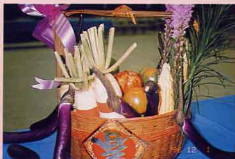
蔬菜+水果+花草=藝術組合， 是愛心媽媽的巧藝