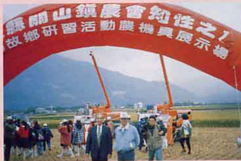
農機具展示田間現場—台東縣政府蔡局長(左)及邱課長(右)親臨現場指導