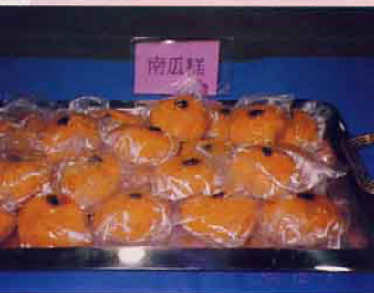
關山米食鄉點—南瓜糕

三、早期的關山鎮為經濟、政治重鎮，即使今日也是個文風鼎盛的小鎮，居民們頗重視子女教育，因此幾乎家家戶戶都有購買鋼琴，學習彈琴的風氣很興盛，據聞鋼琴數占人口的比例，可能是全台首屈一指的。