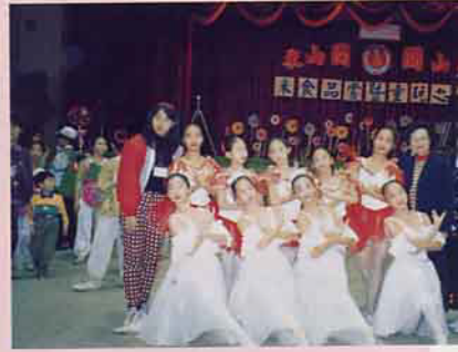
童玩之夜表演一景(東門國小的芭蕾舞群)