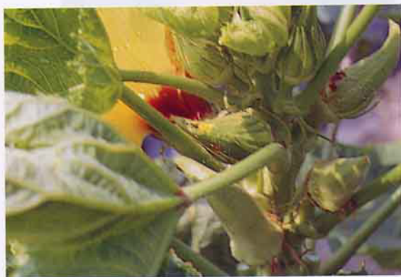
紅螞蟻危害有機黃秋葵果實

使用食品加工廠廢棄物之有機渣滓，運回讓其發酵後，施用到田間作基肥，至於豬糞亦在使用資材之範圍內，方法是把豬糞尿引到一簡單之三格化糞池內發酵，當發酵過之汁液再移到種有布袋蓮之大塑膠桶內，布袋蓮將吸收豬糞尿內之重金屬，然後就可拿到田間當有機肥使用了，「省本又多利」，何樂而不為？草木灰也是