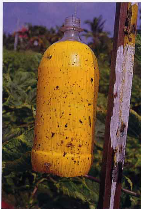
黃色黏瓶誘引小綠葉蟬

有機農法在不同作物目前有不少及不同病虫害的防治，困難度亦不相同，筆者在偶然的機會認識了一對年輕夫婦正經營一片小農場，從事有機蔬菜栽培，該夫婦有心留在農村從事農事，而且也沒接受任何補助，當時筆者相當感動，他們對於「完全有機栽培」做得相當誠實，沒有使用一點化學農藥，也沒有化學肥料，當時有意決定在病虫害防治上幫助他們。 →