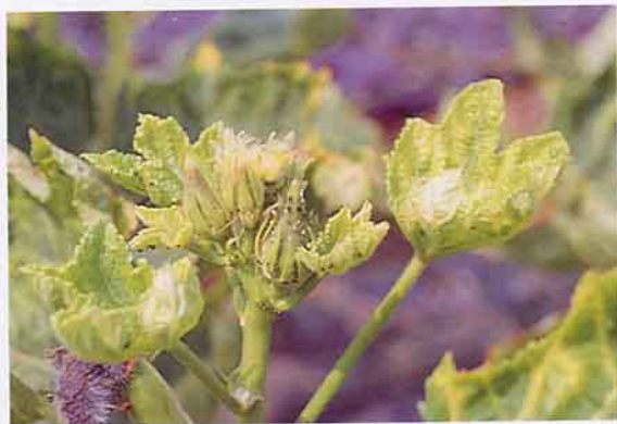
蚜虫危害黃秋葵花芽