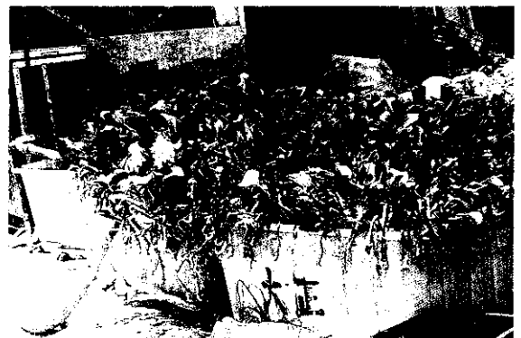
豬排泄物發酵後，利用布袋蓮吸收重金屬

發生在葉片之背面、植稍花芽部位，密度高時花芽變黑、枯死、葉片呈皺縮狀，並有食痕，草蛉是該蟎之剋星，當然捕植蟎效果亦不能否定，一種植物性泡沫也可減少密度，同時對蚜虫等小型群趨型之害虫，亦不妨一試。