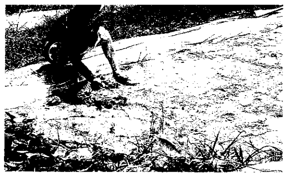
加工後廢育的豆渣，利用做有機肥