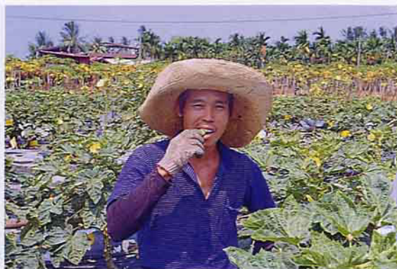
有機蔬菜，「哈馬」好吃！