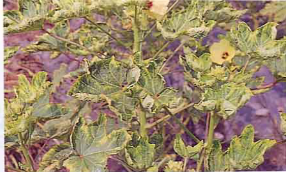
小綠葉蟬危害黃秋葵情形

利用農業展覽結束後，鋪地之地毯當做廢物利用，鋪於田畦、田埂，結果不須除草自然雜草一根不生，因此沒有除草劑所帶來之後遺症，亦可節省成本，該廢棄之地毯既不爛不臭又不會壞，可以一次又一次地重覆使用真划算。