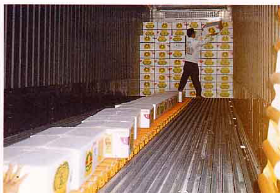
外銷貨櫃內部裝載