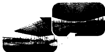
游泳池展張及收閉情形