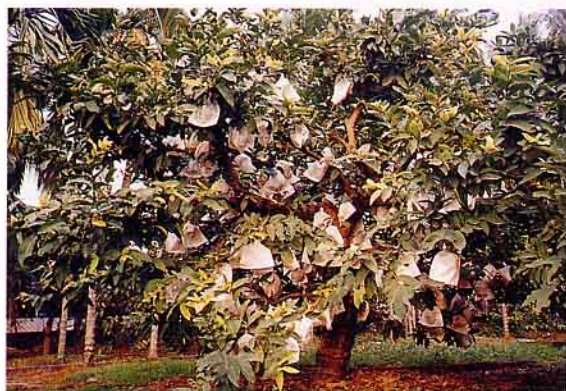
外銷果品採套袋保護，並需通過吉園圃審查

蓮霧外銷試銷自86年12月28日開始，初初只試銷50箱，前後歷經約4個月，25船次，共外銷13,697箱，賺取4,383,005元外匯（如附表），果農與貿易商均感滿