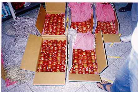
外銷蓮霧選別嚴格