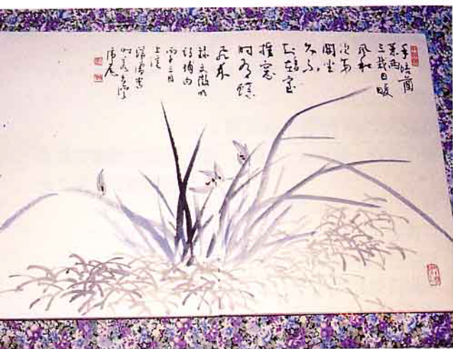
書法落款於國畫作品上，相得益彰

書法是修身養性的一門學問，修身養性動中禪平民藝術好入門。書法之絕妙，不只在藝術的欣賞而已，更在於它所表現出書者的人格、氣度、個性、以及透過書寫的過程所達到的修身養性功夫，這也是其他藝術少有的特質。