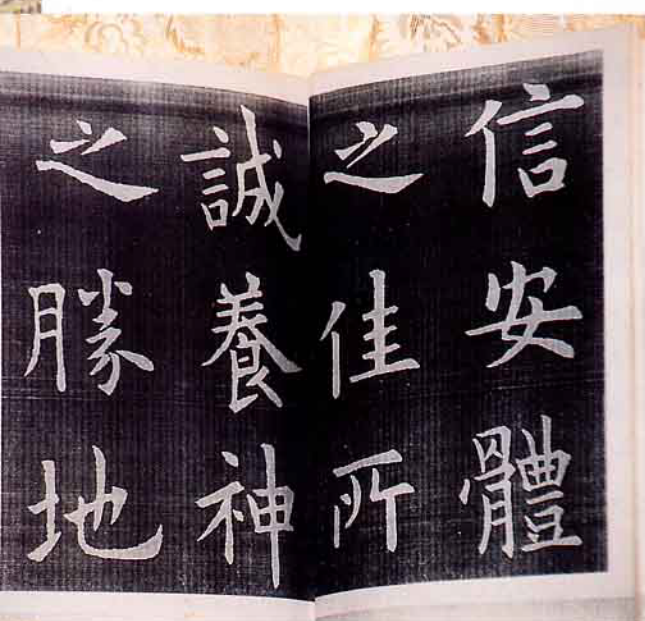
歐陽詢九宮格白帖範本