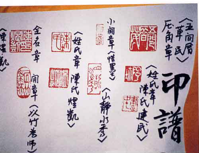
書法運用於傳統金石篆刻

裡看花、似懂非懂。」筆者願以習書法多年的淺見就筆法、韻律、構圖、書法美學的賞析入門，提出個人的拙見供，大家指正。