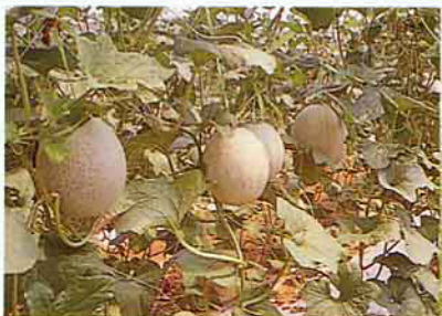
碩大且香醇的洋香 瓜果實掛滿綠蔓間