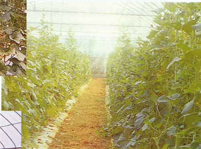
網室內洋香瓜直立式的栽植方式