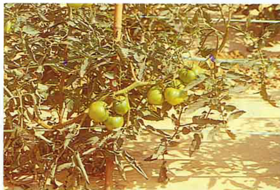
炎熱的九月天即有結果纍纍的果實