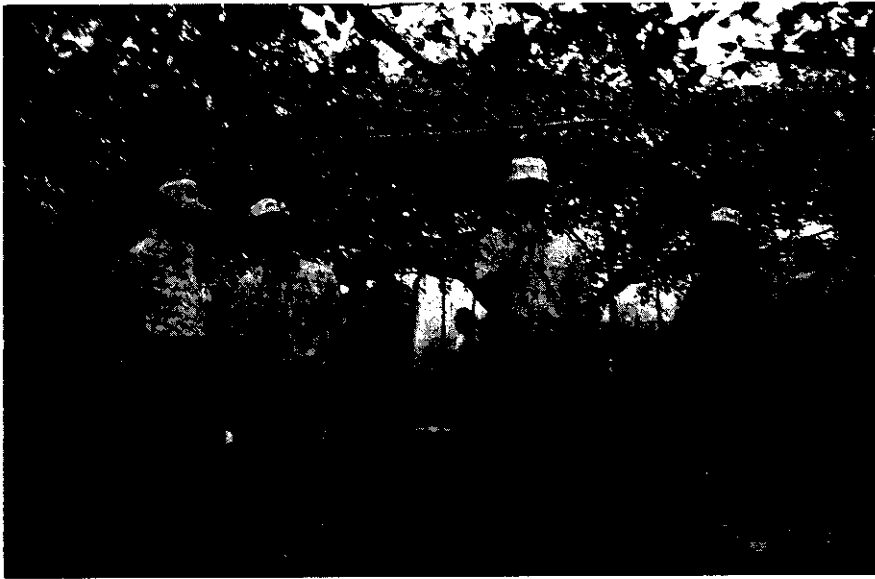
屏東科技大學教授說明 草生栽培之好處

國人生活水準不斷提高，對高經濟水果要求愈來愈多，不但要保證良好品質，而且產品要吃得安全、健康與安心。為迎合消費者要求，面臨農業大環境之改變，進口水果競爭壓力，對本土性水果栽培方法不斷的求新求變，以滿足消費者口味信心，印度棗網室草生栽培從此開始實施；高雄區農業改良場於87年11月26日在屏東縣鹽埔鄉高朗村果樹產銷班14班召開觀摩會，召集高屏縣市果農參加，人數非常踴躍，果農對此活動很有興趣，會中提出許多問題。