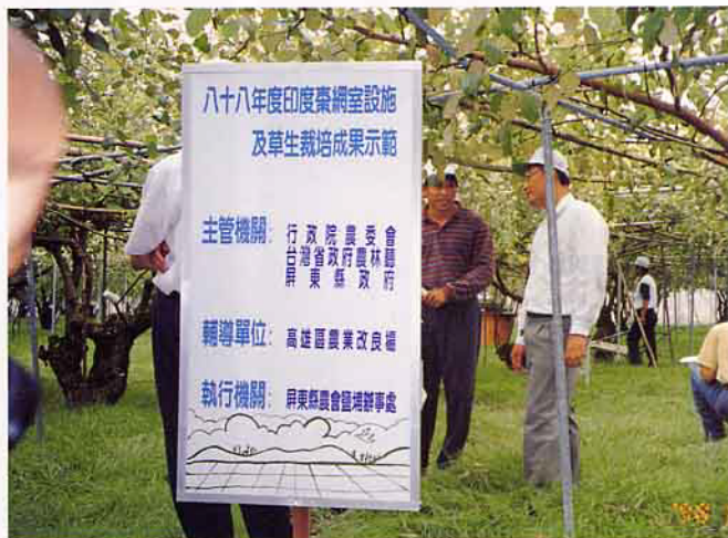
觀摩會現場之看板