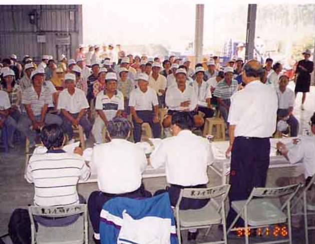
林場長主持觀摩檢討會

765公頃，二縣合計佔全省總面積88.5%，其經濟重要性僅次於蓮霧、芒果。高雄區農業改良場近數年來致力於印度棗品質改良工作，同時對栽培技術之改進亦投入相當多人力與物力，研發成果斐然。