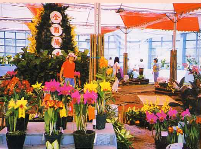
第二梯次的總冠軍得獎作品