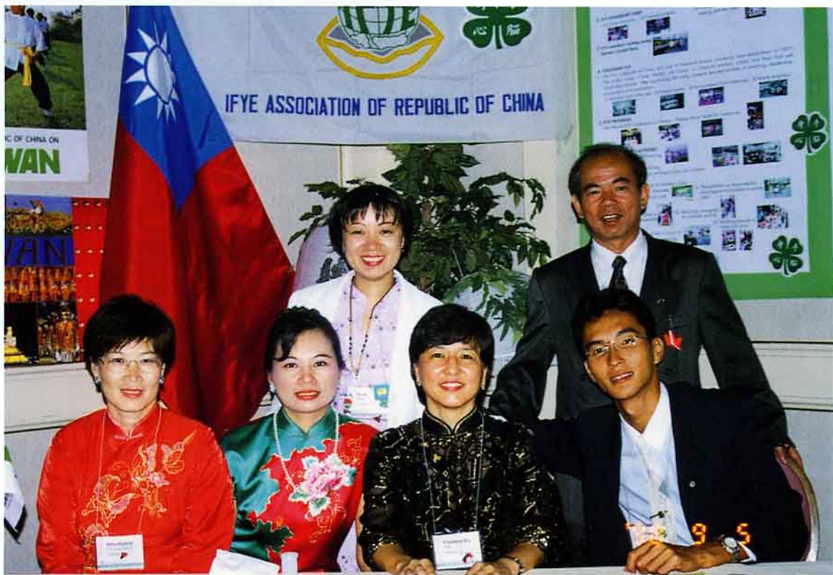
攝於國際之夜，傳統的我國旗袍穿在身上，輕柔婉約，為會場添色

一 四健會組織於1948年成立，所以慶生活動刻意選在美國四健會中心辦理。活動包括各國節目表演、介紹高齡會員、切蛋糕以及烤肉晚餐。我國代表團上台表演山地舞，隊員頭綁彩帶、插羽毛、手穿鮮艷短外套，男隊員穿黃色、女隊員穿紅色。由於事先演練加上賣力演出，獲得各國代表之讚賞。