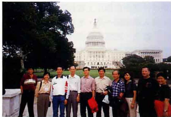
為了輕鬆一下，特安排華盛頓 D.C. 觀光

為了輕鬆與會代表之心情，特別安排首都觀光。華盛頓的地鐵世界有名，整潔、快速、令人好感，沒多久就到達華盛頓的行政中心。附近有白宮、華盛頓紀念碑（高五百英尺）、國會大廈、國家博物館、太空科學館、造型典雅的教堂，由於景點太多，只得挑幾處參觀，黃昏時刻全體代表在國會山莊前拍團體照，由於人數衆