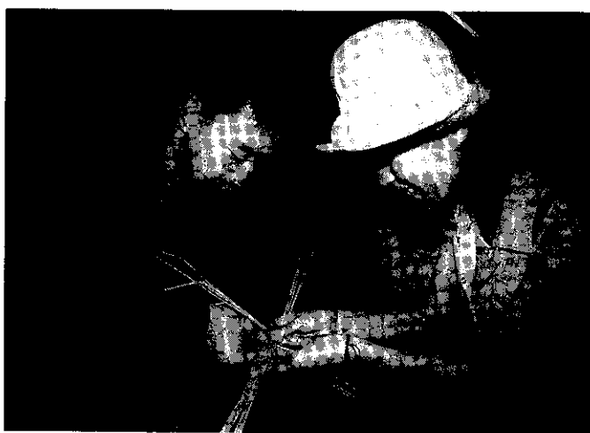
「不孕夫婦」更應彼此關懷，相互扶持

方都不要有太多工作或情緒上的壓力，保持輕鬆的心情，隨時不忘增加生活情趣，使懷孕更順利。