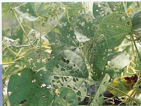
受害植株樣本寄送診斷服務站檢驗