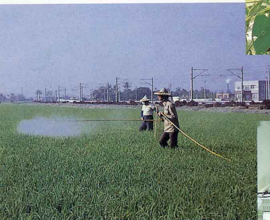
藥劑使用洽診斷服務站