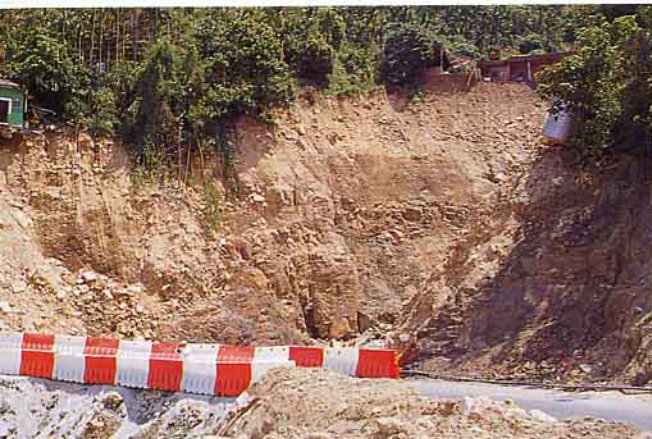
土石流流動導致溪谷邊坡受侵蝕，房屋岌岌可危