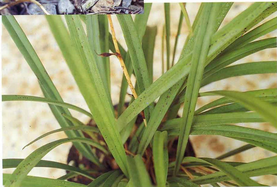
國蘭細菌性褐斑病病徵