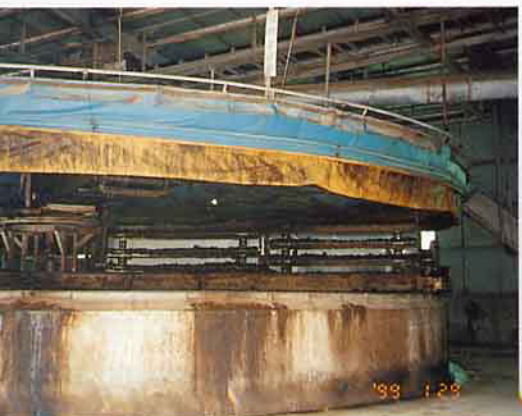
密閉式有機肥醱酵槽