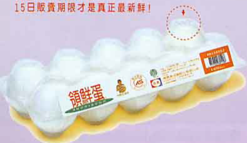
來自石安牧場的「領鮮蛋」