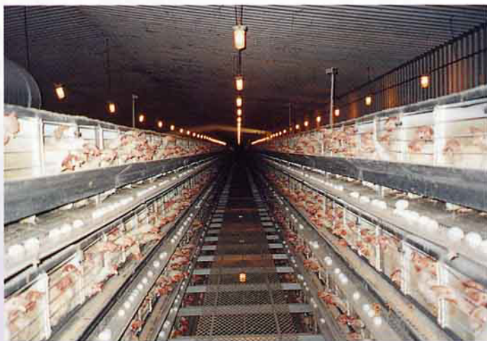
石安牧場自動化養雞場

下毒害自己的物質，傷害自己。種種恐懼的心理，及解決問題的途徑，令我們不禁又想起老祖宗那最符合大自然法的「有機」守則了，拋棄化學肥料、農藥、生長激素等，取之自然用之自然的原始規則，不破壞自然也不毒害同胞。大家愈具有機概念，愈表示道德觀在提升，社會在進步。