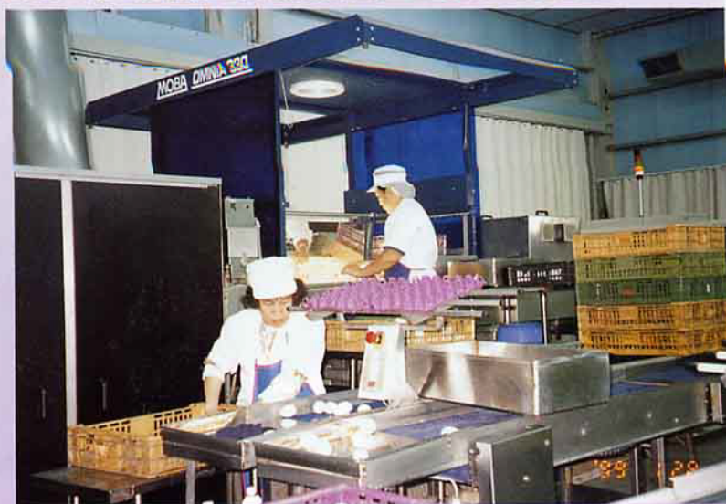
利用精密儀器甄納檢測洗選蛋