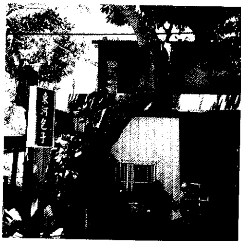
位在東河分駐所前面的「東河包子」店，除包子好吃外，連門前姿態優美的大樹都讓人驚艷

算是二代傳人的他覺得現在所賣的包子，和當年父母親經營時的包子相比，不論是肉餡、手工力道等都是毫不遜色的，尤其現在一個才賣十元，價錢算是十分公道，因此希望舊雨新知們到東海岸遊玩時多來捧場。