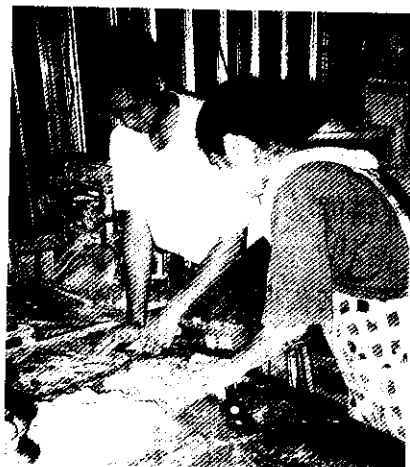
「東河包子」講究的是手工和肉餡都實在