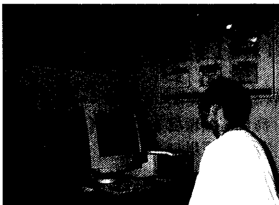
農產品網路商城，增加國產農產品的銷售通道

該網站的推出不僅深深吸引住消費者的目光，也讓純樸的農民享受從未有過的科技行銷之美妙經驗，由於這種美妙經驗廣為流傳，願意上網供貨的產銷班與農民已達54家，目前該網路商城銷售蔬菜、水果、農特產品、特用作物、糧食、花卉及畜產肉製品等7大類農產品，銷售品項有340餘種，自87年11月至88年3月共銷售7,800餘台斤。