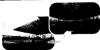
游泳池展張及收閉情形