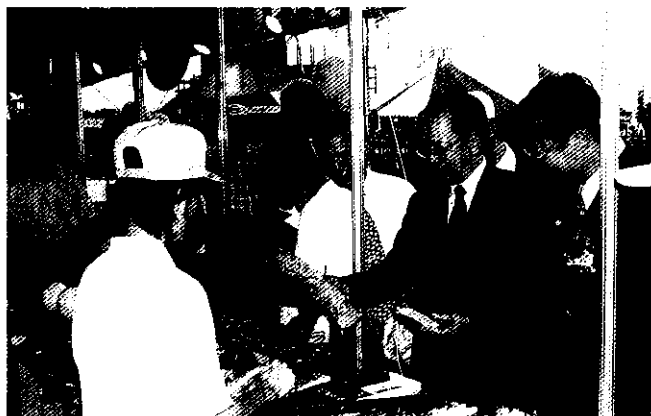
1999「畜產嘉年華」彭主委親臨會場，呼籲消費者「愛鄉、愛土、愛咱的農產品」，讓本土農業永續發展

這次我提前開放入會後第一年畜禽產品進口配額，對畜牧產業造成之衝擊，彭主任委員除在場宣示農政單位已做好充分準備，並勉勵畜牧業界代表與參展廠商共同推動各項措施；彭主委表示，「畜牧法」及其施行細則已經制定，動植物防疫檢疫局亦已成立，因此，畜牧事業將在完整的法制規範下，落實各項既定政策與輔導措施。在完成離牧計畫後，國內的小養豬場及小養雞場的數目將可大幅減少，生產力