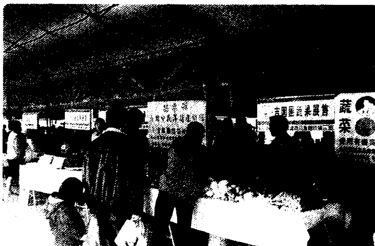
產銷班班員參加蔬菜展售活動