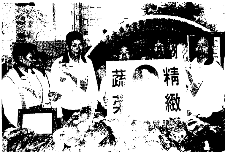
台北建國花市蔬菜展售活動

功，於是與志同道合之好友從工廠轉業來種菜，種植三分地年收入可達百萬元以上。收入增加，家庭小孩均能兩顧。後來由於單打獨鬥的時代已過去，所以在83年9月成立蔬菜產銷班，以種植設施蔬菜為主，露地栽種為輔，並建立品牌，以保證產品之品質優良。由於各級政府之輔導與獎勵資助，本班業績一