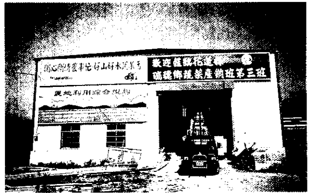
班集貨場及班場所

瑞穗鄉位於花蓮縣南端約60公里外，亦是秀姑巒溪泛舟遊覽勝地之起點站，本鄉蔬菜栽培面積約有270公頃，主要栽種瓜果類，其中以苦瓜、角瓜、甜椒、絲瓜、花胡瓜、番茄為大宗。近年來政府為順應貿易自由化及經濟國際化之世界潮流，正積極準備加入「世界貿易組織」(WTO)，而台灣傳統的小農經營型態，效率低、成本高、競爭力弱，面對未來加入WTO的衝擊，必須以堅實的組織發揮互助合作的團隊精神，凝聚成為產銷共同體，進而提高農業競爭力，提高收益確保永續經營發展。「入農場捲袖揮鋤其急如風，出農場盛裝握筆其徐如林」，正代表著現代農業企業化經營之最佳寫照，而它更是瑞穗鄉一群農村青年的夢想與理想，因而本著如此的共同信念宗旨，成立瑞穗鄉蔬菜產銷班第三班，所有班員均朝著共同的目標而