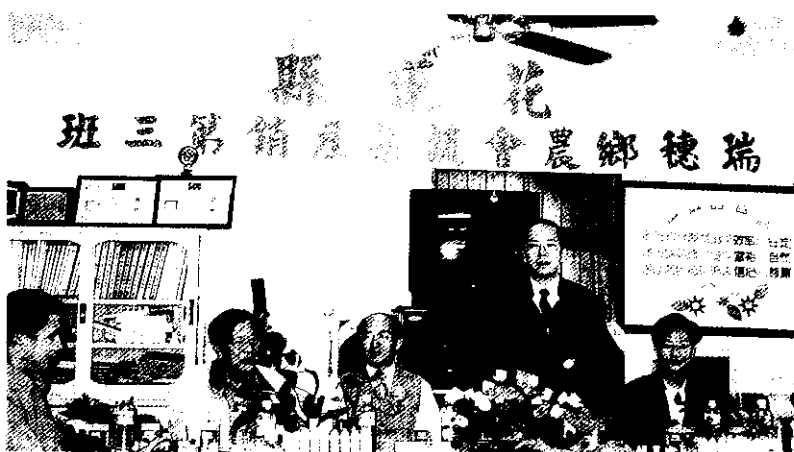
農委會彭主委蒞臨本班嘉勉班員在農業經營上的辛勞與貢獻

4. 從事農機研究，自行成功研發改裝噴藥車，提高噴藥效率，節省勞力及工作時間，有效降低生產成本。