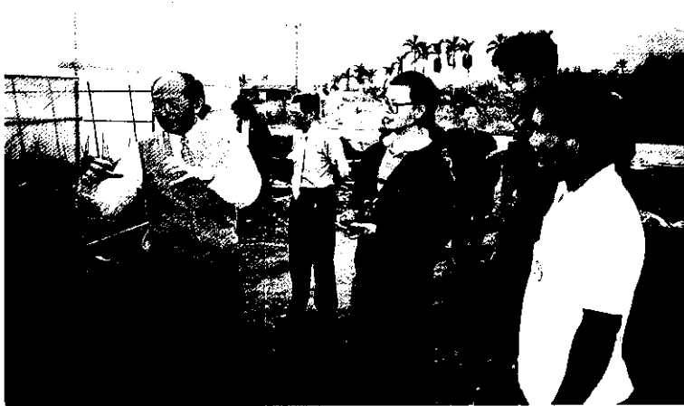
花蓮區農業改良場場長率領主管及技術人員執行田間技術諮詢服務