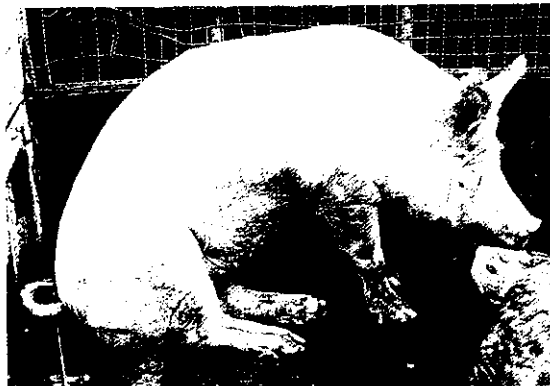
罹患動物因蹄冠部水疱潰爛疼痛而跛行或不願行走

由於豬隻口蹄疫曾造成國內經濟面重大衝擊，近日在金門地區又發現牛隻血清檢出口蹄疫病毒及中和抗體的偏高，致使對該疫情的防治工作倍受國人矚目，茲為應此一迫切課題，農委會動植物防疫檢疫局與各地方政府動物衛生主管機關以機先與積極態度，全面進行各項防治措施，並與飼主及全民一起來，共同防堵口蹄疫的入侵與蔓延。