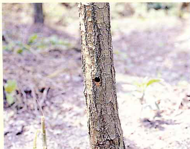
桑天牛造成的蟲孔