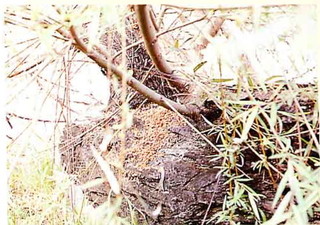
桑天牛排出的蟲糞