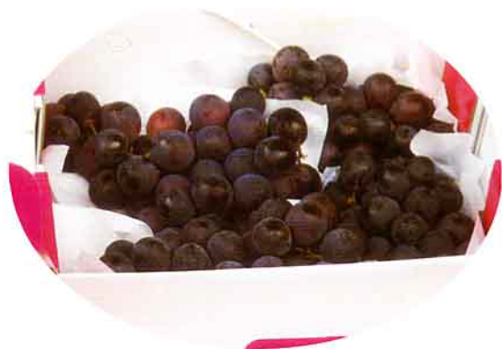
7-8月是葡萄的盛產季

葡萄的果實香甜可口，風味清馥，果實含有豐富的營養成份，常吃葡萄果實或鮮果汁具有養顏美容、補充體力、消除