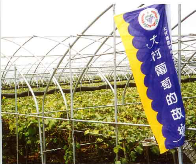
管理完善的葡萄園

葡萄的果實香甜可口，風味清馥，果實含有豐富的營養成份，常吃葡萄果實或鮮果汁具有養顏美容、補充體力、消除