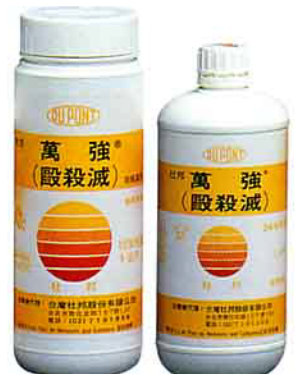
萬強 10% 粒劑

萬強 10% 粒劑防治對象： 蕃茄-根瘤線蟲 煙草-根瘤線蟲 甘蔗-寄生性線蟲 晚香玉-根瘤線蟲