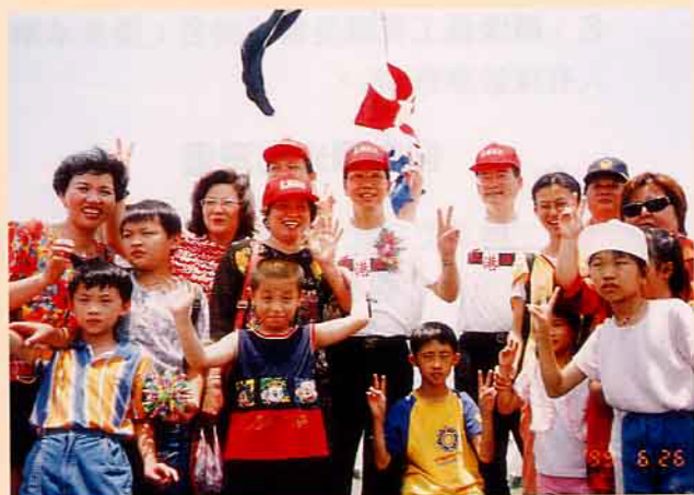
陽光基金會的大小朋友與彭主委、胡署長等長官及貴賓於「巡護6號」上合影