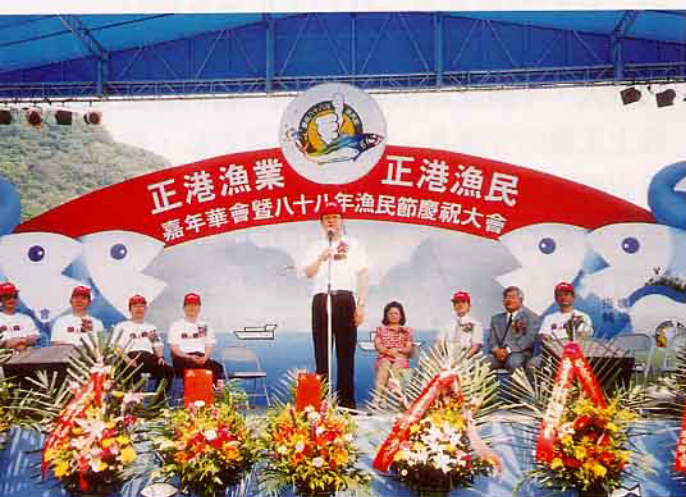
農委會彭主委與會致詞，表示漁業正朝著多元化的方向在發展

「？」。原來在民國48年那時候，由於中央及省有關方面，根據漁民朋友的反映意見，表示：「我國海岸線綿延，漁業資產豐富，尤以本省四面環海，水產事業所佔地位甚為重要，為發展水產事業鼓勵漁胞