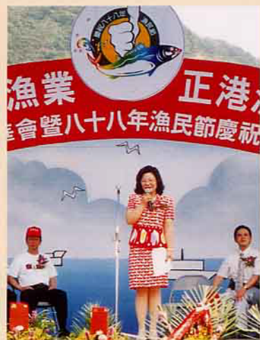
省漁會鄭理事長籲請漁民共同來打擊犯罪

→ 情緒，請政府考查我國水產業之淵源，明訂漁民節日」。到了民國49年更由台灣省漁會第四屆第二次會員代表大會決議「定每年7月1日為漁民節」。如此，一年一度的漁民節，到現在已經有40年了；由於今年的漁民節正處於跨越千禧年，也是本世紀末最後的一個漁民節，因此主辦單位行政院農業委員會漁業署，高雄市政府漁業處及台灣省漁會，特別於6月26~27日在基隆的碧砂漁港，舉辦一場別開生面的「正港漁業·正港漁民嘉年華會暨88年漁民節慶祝大會」。