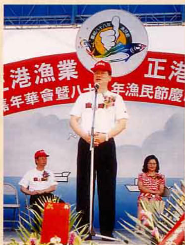
漁業署胡署長說：台灣漁業將走向現代化，有競爭力的漁業