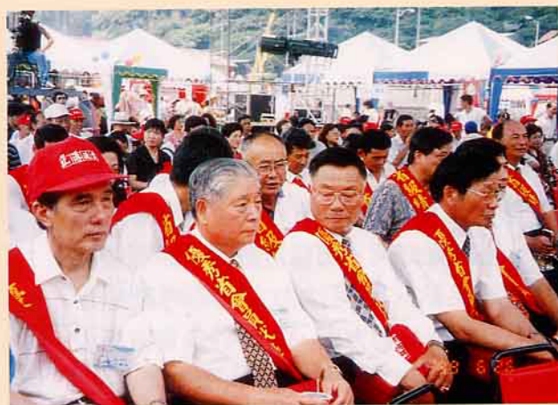
漁民節慶祝大會頒獎表揚「正港漁民」

漁民節慶祝大會中，一項特別的節目便是要表揚終年辛苦的漁民朋友，並安排由彭主委、胡署長等長官、貴賓來頒獎，