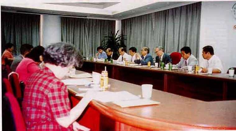
◀ 豐年社第12屆第2次董監事會在農委會112室舉行