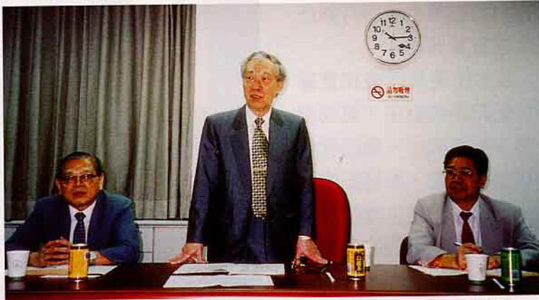
◀ 豐年社王董事長主持董監事會