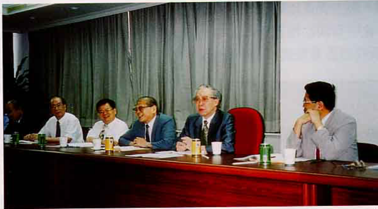
▲ 洪社長（右3）對豐年社的奉獻心力及努力的成果，倍受董監事的嘉許及肯定