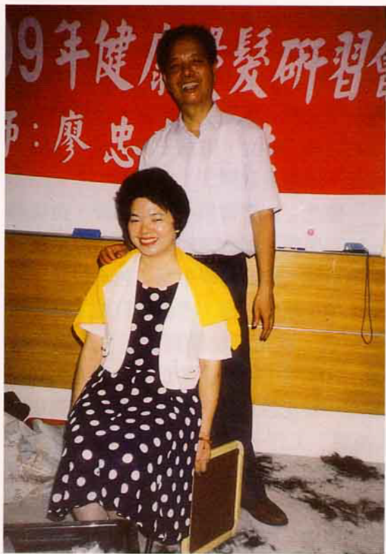
適合的髮型，可以襯透個人的特色

偶然的機會認識了一位對美髮業貢獻良多的某公司何經理，他對頭髮的保護不遺餘力，遠從德國進口原料，在台灣研製各種燙髮藥水與護髮產品；然而，優良的產品也需要優良的技術師來操作與講解，期許每位美髮師都能為太太、小姐們燙出