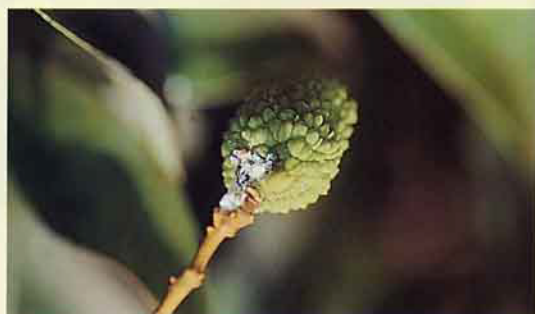
黃綠綿介殼蟲危害幼果情形