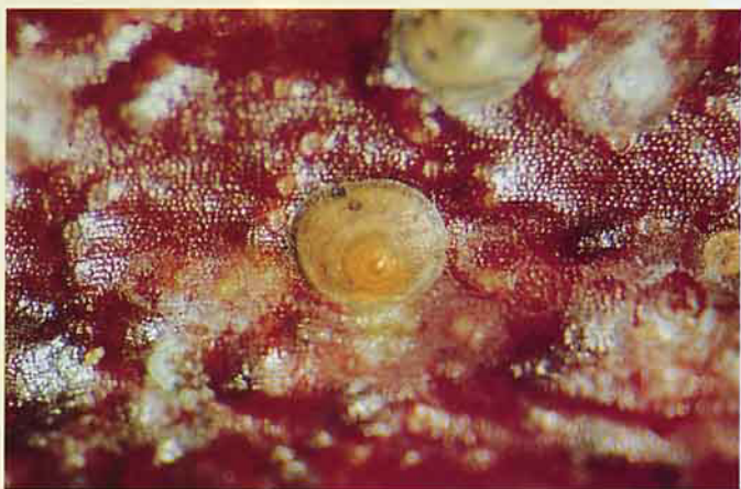
梨圓盾介殼蟲(笠圓盾介殼蟲)