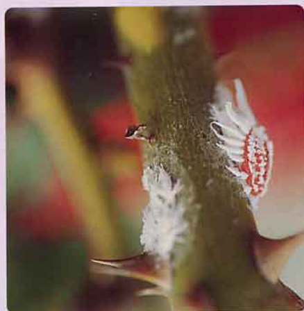
埃及吹綿介殼蟲危害枝條情形