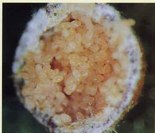
咖啡硬介殼蟲之卵