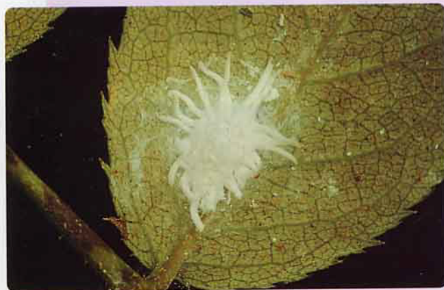
埃及吹綿介殼蟲危害葉片情形