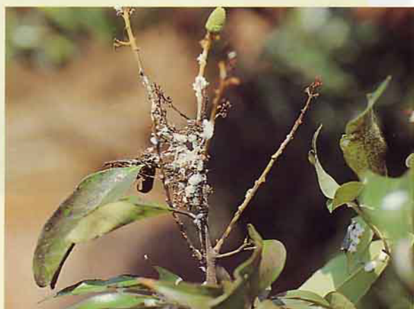
黃綠綿介殼蟲危害情形