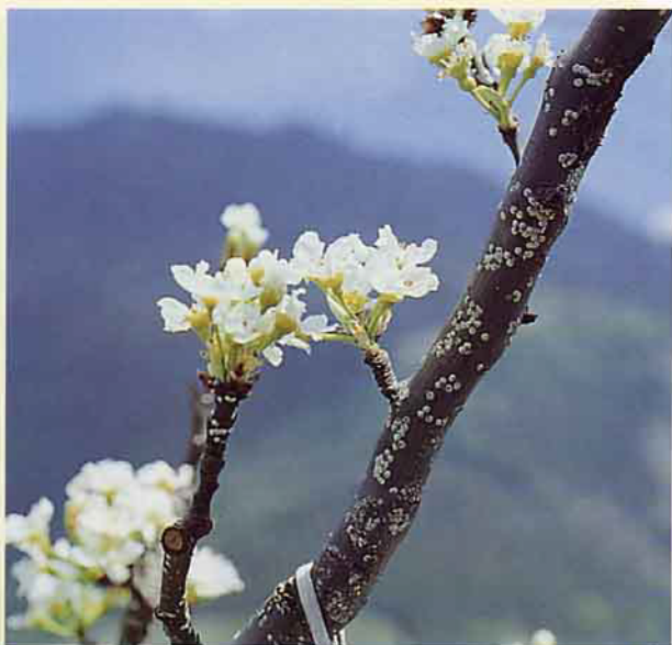
桑(白)介殼蟲危害情形