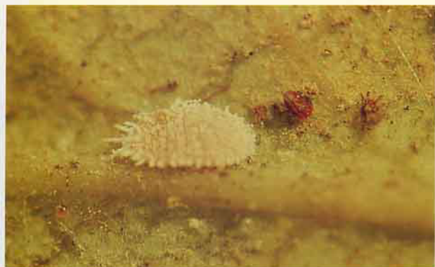
太平洋臀紋粉介殼蟲