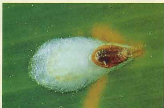
椰子擬輪盾介殼蟲