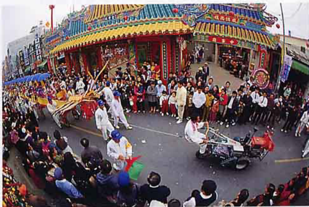
耕耘機拖著蜈蚣陣前進（佳里）

蜈蚣陣人物是由5~12歲學童扮演，以歌仔戲妝戲服扮像，不作任何技藝表演，而孩童之生肖皆由主神降旨指定，如金唐殿丙子科108人蜈蚣陣，採用肖羊（5歲起）、馬、蛇、龍、兔、虎、牛、鼠