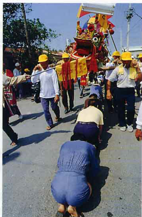
村民鑽蜈蚣陣（學甲）