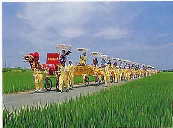
麻豆代天府蜈蚣陣