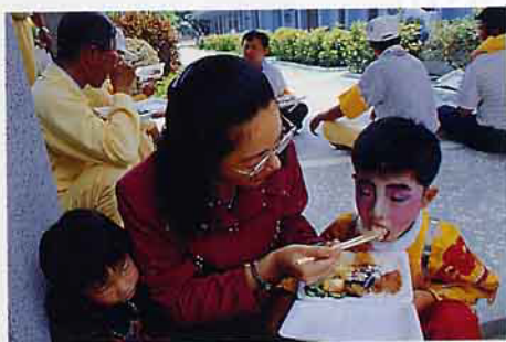
孩子的媽說盡好話喂食