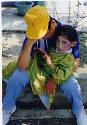
孩子的爹累了先睡