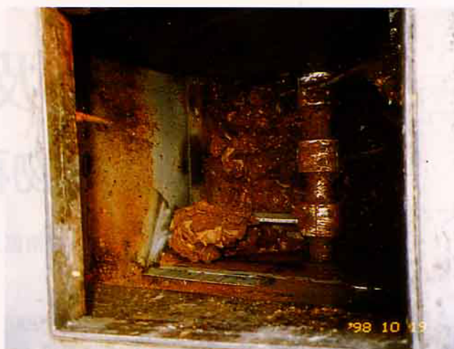
打碎、攪拌、脫油水、加溫、發酵分解、脫臭等作業情形全自動作業

快速發酵廢棄物再生處理機（飯渣製肥機）之主要構造由進料裝置、濾油水裝置、打碎裝置、第一至第三槽攪拌、脫油水、發酵、分解裝置、有機質肥料成型槽裝置、脫臭處理裝置、加溫裝置、控制裝置及傳動輸送裝置等裝配組合而成。該機有濾油水裝置及打碎裝置，可減少進入發酵槽容量(1/3~1/6)及提高工作能量，對於骨頭、貝殼等都能處理，並可隨時投料，不須操作，老少皆能勝任，製造過程中不會有惡臭，乾淨又衛生，可把廚餘變成有機質肥料，有效用來綠化環境中之花果園及盆栽等。高速發酵廢棄物再生處理機作業能力，從進料、濾油水、打碎、攪拌、脫油水、發酵、分解、脫臭、加溫、