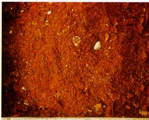
廚餘經過飯渣製肥機作業後製成的有機質肥料