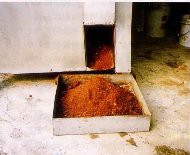
廚餘經過飯渣製肥機作業後製成的有機質肥料情形

有機質肥料出料等一貫作業，小型者發酵槽二槽，每天處理能量60公斤以上的廚房殘羹剩餚，相當於750個學生每人殘餘80公克食物殘渣量，廚餘自進料到有機質肥料出來大約1~2天，每日可製造有機質肥料大約2~4公斤，容量大約減少1/15~1/30。大型者發酵槽四槽，每天處理能量160公斤以上的廚房殘羹剩餚，相當於2,000個學生每人殘餘80公克的食物殘渣量，廚餘自進料到有機質肥料出來全程大