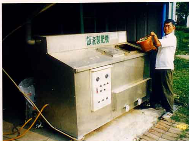
飯渣製肥機投料情形

台灣地區每天產生的家庭垃圾約26,000公噸，目前主要處理方法是焚化處理、掩埋處理、不當丟棄及分類回收等。焚化處理目前有內湖、木柵、新店、樹林及台中市等五處完工運轉，最高處理能量5,500公噸/日；掩埋處理台灣地區現約有300座垃圾掩埋場，其中有6成已經飽和，這些掩埋處理場常因污水外溢惡臭，造成二次公害，而不當丟棄約有4,500公噸/日，這些不當丟棄的垃圾或利用河川地作為垃圾場，不但與水爭道，更嚴重污染了地下水源，造成病蟲害孳生及破壞生態環境。又根據統計台灣之家庭垃圾每天的廚餘殘羹剩餚佔35%、廢棄物佔13%、落葉佔7%、可回收資源佔45%。