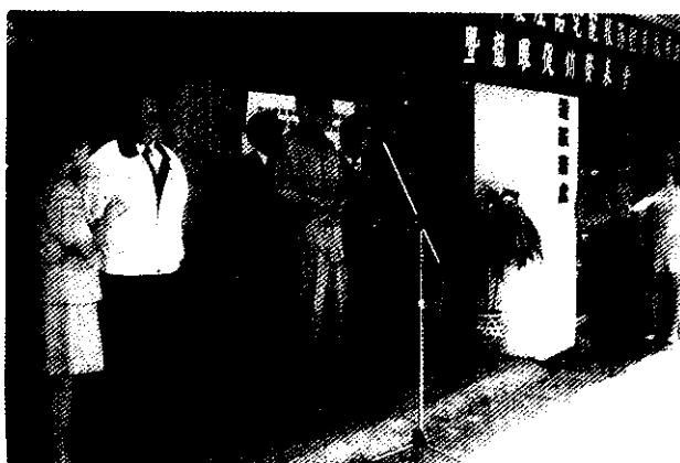
台北市農會理事長在典禮上致詞