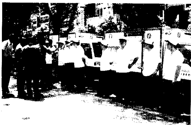
宅配服務隊，整「裝」待發