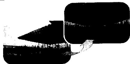
游泳池展張及收閉情形