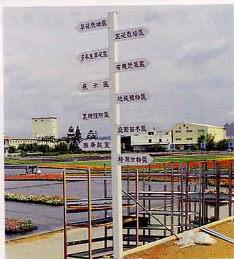
預先立好的分區路標，顯示場區幅員遼闊及規劃完善的決心