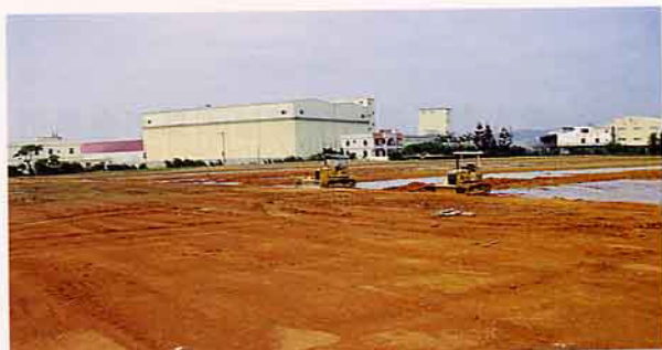
87年初時，農場尚處草創階段，黃沙滾滾一片荒涼

將企業管理觀念引進農場經營，使用電腦作業系統提昇經營效率，連滑鼠墊的圖案很講究的是日日春，才符合農用