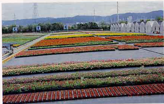
88年6月的草花生產區，在配合軌道自走灌溉天車量產草花