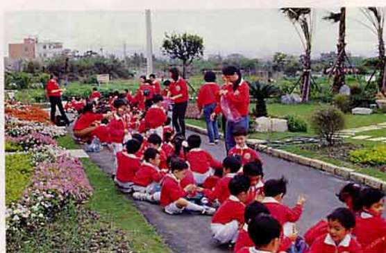
將花卉農業消費推廣教育視為農場的社會責任及多元經營目標之一