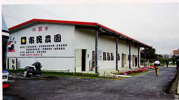
兼營市民農園，創造農場附加的經營價值

將企業管理觀念引進農場經營，使用電腦作業系統提昇經營效率，連滑鼠墊的圖案很講究的是日日春，才符合農用