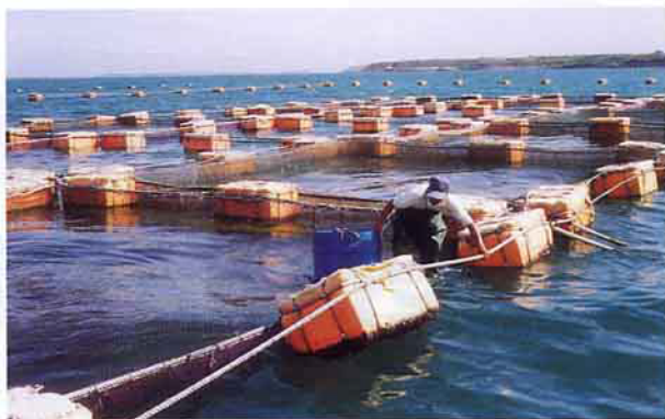
澎湖傳統軟式箱網養殖

由於海上箱網養殖，具有水質條件良好、養殖物品質優良、成長快速，以及對陸地水土資源低依賴等優點，預期將成為養殖漁業中新興而重要之一環，但箱網養殖之發展，勢必要在生產、生活、生態之間取得平衡，才可促使產業永續發展。🌱