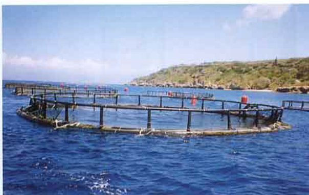
挪威式箱網系統