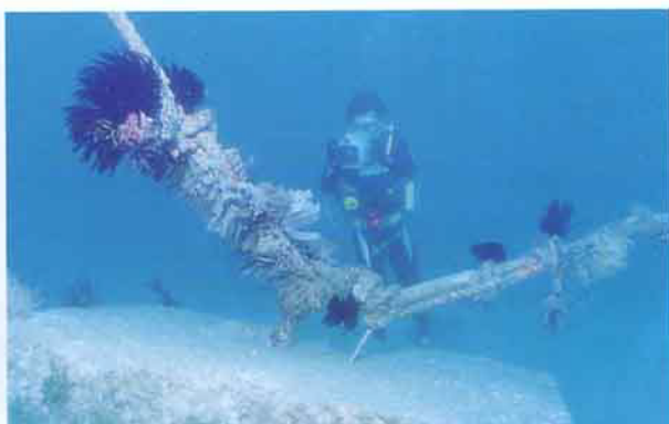
箱網之錨碇系統