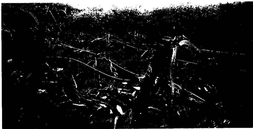
地震斷層帶上的農田，被震得東倒西歪，也震毀了災區農民的經濟來源；圖為卓蘭鎮內灣里紅龍果園