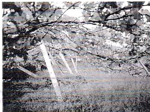
卓蘭內灣葡萄園棚架倒塌