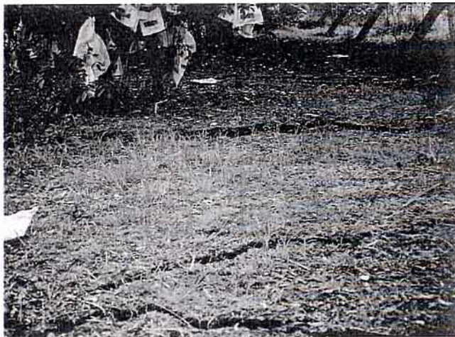
卓蘭內灣楊桃園地層龜裂情形

七、土壤水分不足時樹體水分含量低，果實直接日曬容易發生日燒，應誘引枝條覆蓋果實及套袋，預防果實發生日燒。