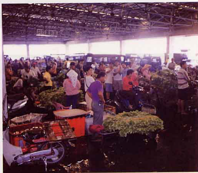
西螺果菜公司每天運銷的果菜佔全省三分之一