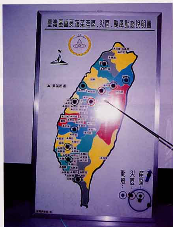
紅圈是災區；綠圈是產區（紅圈3~5個屬嚴重）

西螺果菜市場交易程序是，進貨分類排列→議價→過磅→交貨→計算貨款→包裝→委託代收代付→運銷至全省各地。