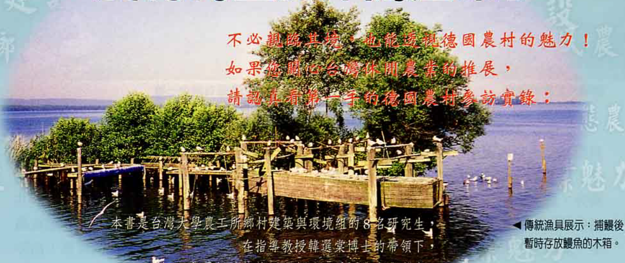
◀傳統漁具展示：捕獲後暫時存放鱖魚的木箱。

不必親臨其境，也能透視德國農村的魅力！ 如果您關心台灣休閒農業的推展， 請認真看第一手的德國農村參訪實錄：