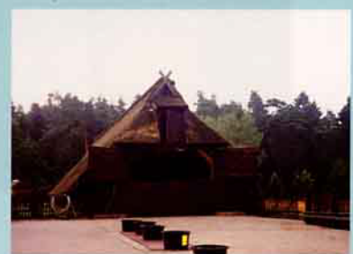
▲北德綠恩布格草原上的傳統茅草屋羊舍。