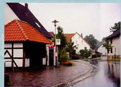
▲蜿蜒的鄉間小路旁，有電話亭與候車站。

台北市溫州街14號 郵政劃撥 00059300 豐年社 門市電話 (02) 2362-8148 轉 30 或 31