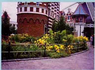
▲生態式庭園善用多樣化的植栽及高低層次的設計手法。