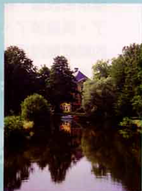
▲鄉村河流綠蔭處處，提供良好的生態環境。