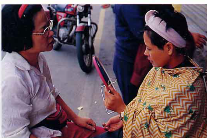
看看挽過的容顏，是否更美？！

一 面，兩腳交叉，首先取毛巾將顧客的額頭髮際包紮，讓頭髮不致垂下來，然後臉上全面抹上一層白粉，令皮膚乾燥些，也讓汗毛比較容易處理。接著進行修眉毛和額頭之頭髮，以鉗子將多出的毛髮一根根拔起，讓眉毛之造型適合顧客臉型。