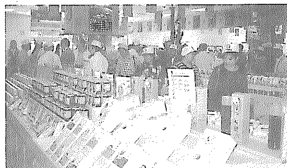
台東縣農特產品展售中心場地寬廣，貨品齊全