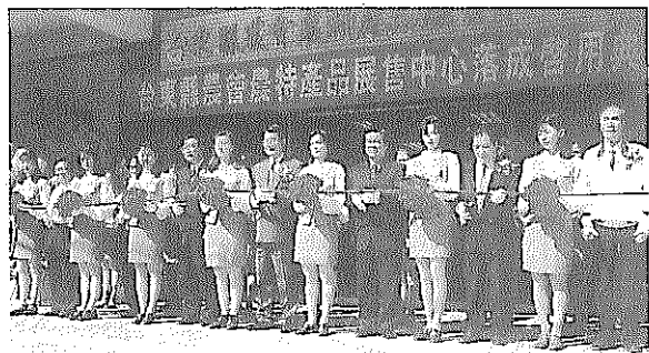
長官蒞臨剪綵啓幕