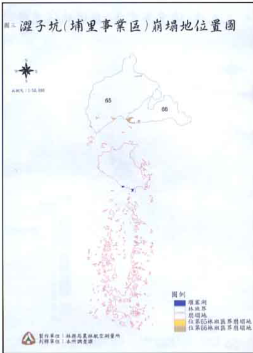
圖三 澀子坑(埔里事業區)崩塌地位置圖