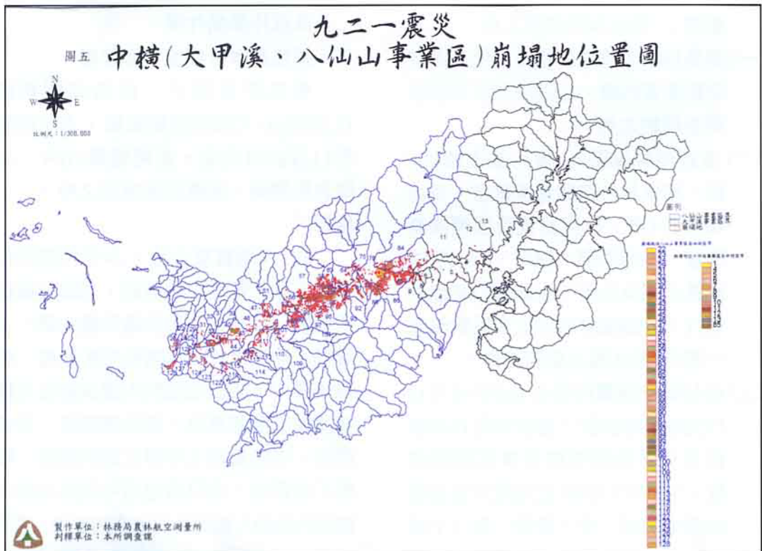
圖五 中橫(大甲溪、八仙山事業區)崩塌地位置圖