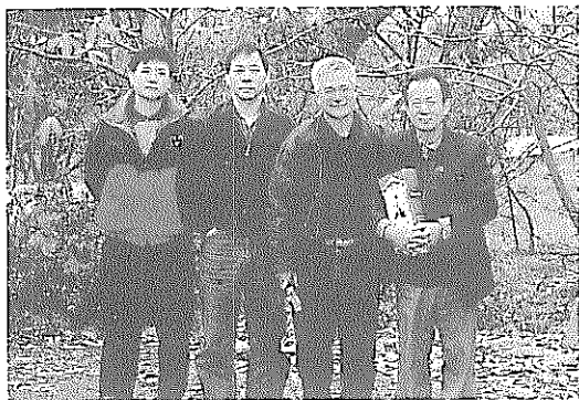
筆者（右一）與友人合影