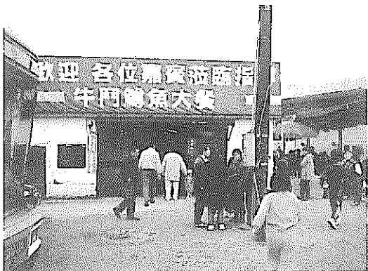
鄉土飯店，價錢合理又好吃

看這古厝的風格，重新翻新，蓋起來比蓋新屋還麻煩，我跟簡庄主談了良久，想起做人哲學：「只要每個人有心要做一件事；只要持之有恆，天下就無難事。」從簡庄主身上，我們即可得到這份成功的寫照。