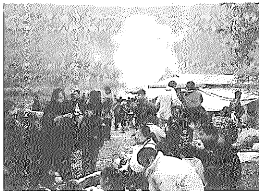
宜蘭也有地熱谷，就在三星鄉