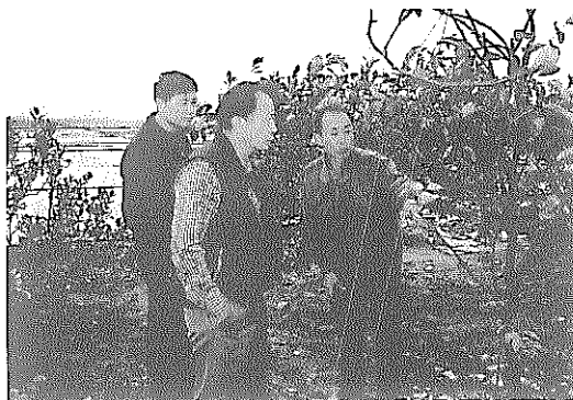
枝條拉線是讓樹姿四處迎向陽光