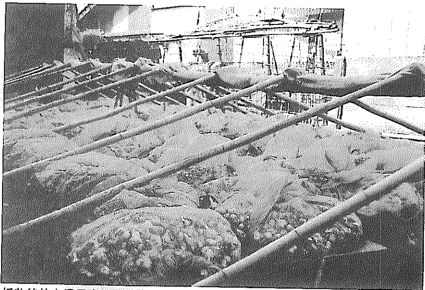
採收後放在通風處陰乾情形

一 蒜頭飆漲戲碼，年年上演。因此，仍然應該以有條件的專案進口為宜。當然此舉必須有配套的作法，避免開放進口後，對國內新蒜價格造成打擊。