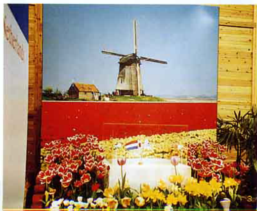
荷蘭展出的花卉事業