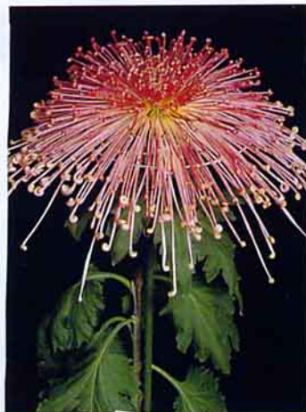
新育成的十種大菊，其花形花色