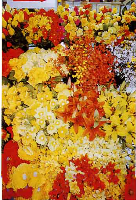
日本「淡路花博」花團錦簇

一 大吊橋－『明石海峽大橋』看海的漩渦；日本人又以廣闊的會場四週，創造都市公園，圓大眾的美夢而感到自傲。