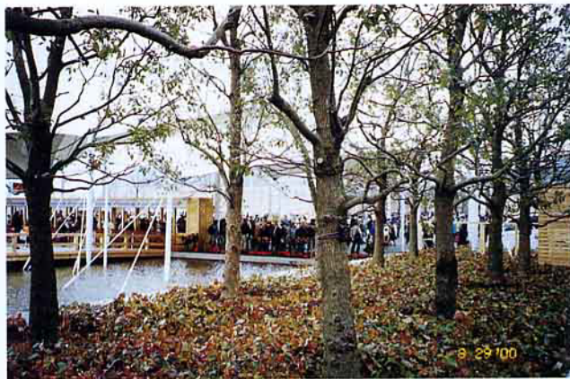
日本「淡路花博」中之庭園

的關係。陸陸續續有些國家不斷湧入展覽會場共襄盛舉。到今年4月中旬為止，已經有來自日本各地及世界各國的1700種150萬株花卉及世界及日本前100