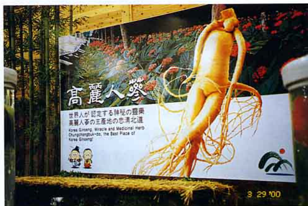
韓國展出的高麗人參產業

的關係。陸陸續續有些國家不斷湧入展覽會場共襄盛舉。到今年4月中旬為止，已經有來自日本各地及世界各國的1700種150萬株花卉及世界及日本前100