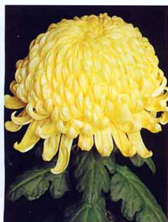
新育成的十種大菊，其花形花色